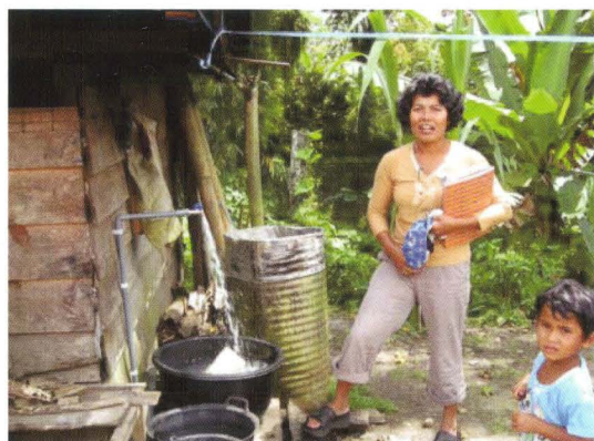
nieuwe situatie: schoon water thuis

Stichting Marsiurupan Giro 4871892 Dordrecht