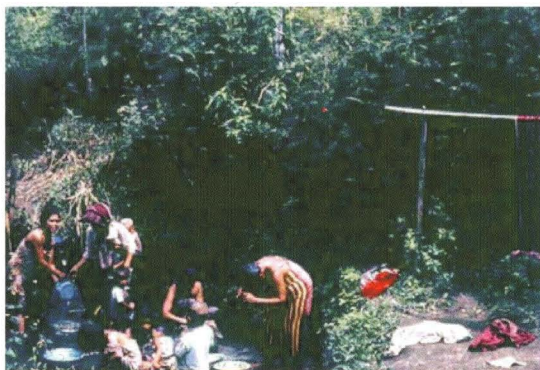
oude situatie: vuil water ver van huis

Verbeteren gezondheid door schoon drinkwater dicht bij huis